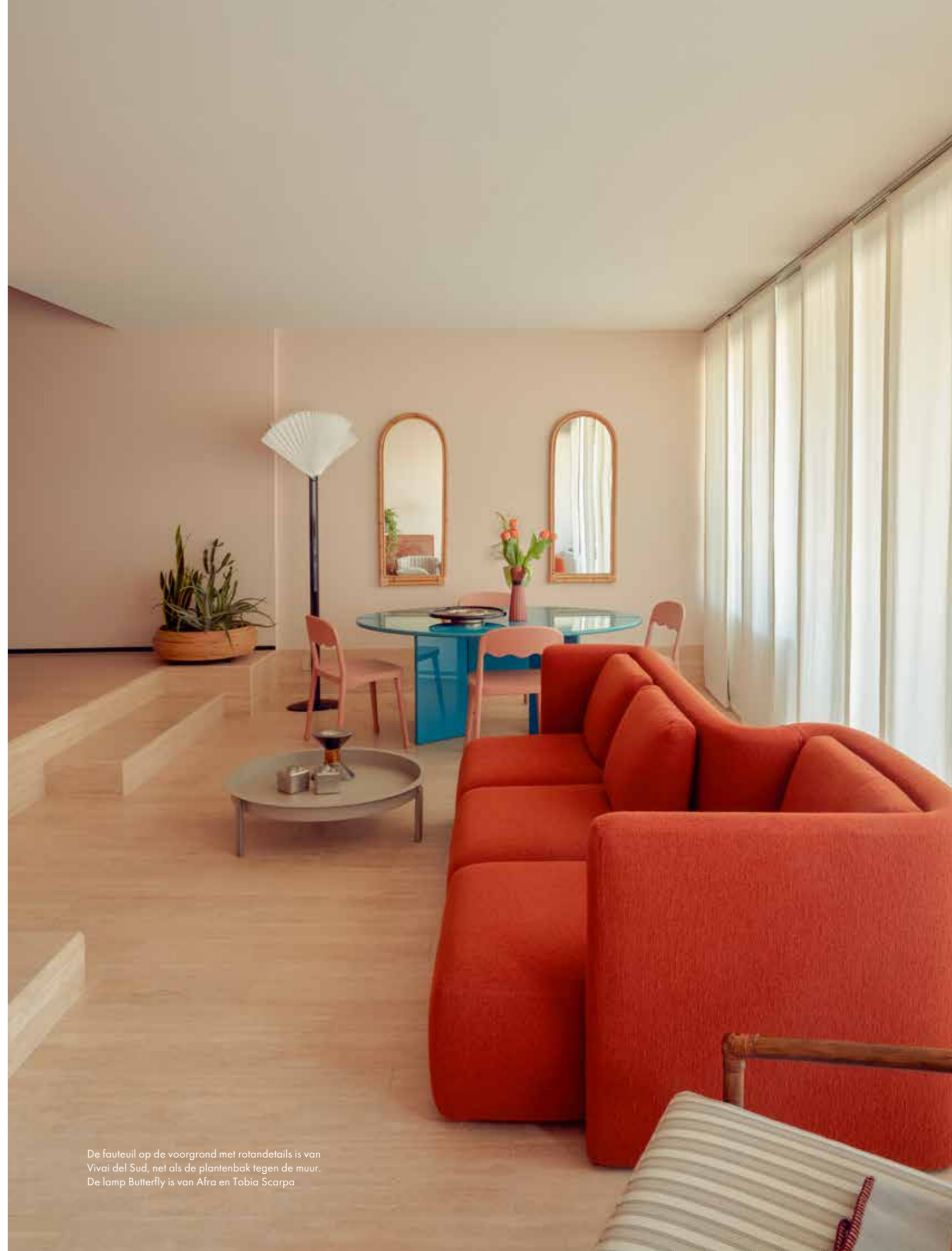
De fauteuil op de voorgrond met rotandetails is van Vivai del Sud, net als de plantenbak tegen de muur. De lamp Butterfly is van Afra en Tobia Scarpa