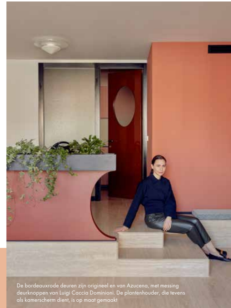
De bordeauxrode deuren zijn origineel en van Azucena, met messing deurknoppen van Luigi Caccia Dominioni. De plantenhouder, die tevens als kamerscherm dient, is op maat gemaakt